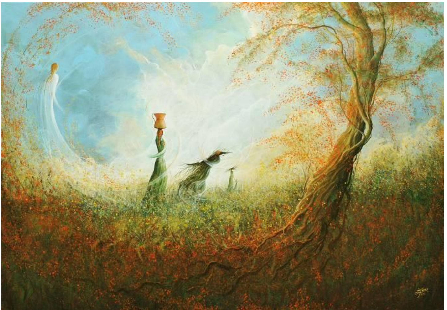
RITORNO DAI CAMPI