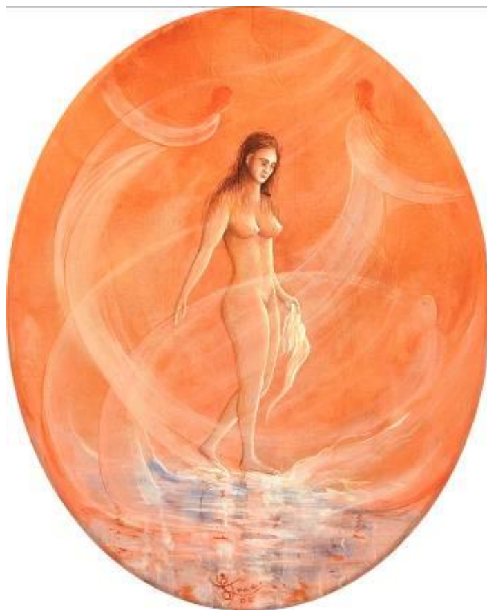
NUDO CON ANGELI

Le sue opere sono segnalate su quotidiani nazionali, riviste e cataloghi: particolare risalto gli è stato riservato nel catalogo "Mercato & Arte", nell'"Annuario Comed", nell'"Enciclopedia Artisti Contemporanei", nell'"International Directory of Arts" ed altri ancora. La documentazione è disponibile nell'Archivio Storico della Galleria Nazionale di Arte Moderna e Contemporanea di Roma, nell'Archivio storico della Biennale di Venezia, nel Museo dell'Etichetta di Cupra Montana, nel Museo Comunale dell'Informazione di Senigallia (AN) e nel Kunsthistorisches di Firenze.